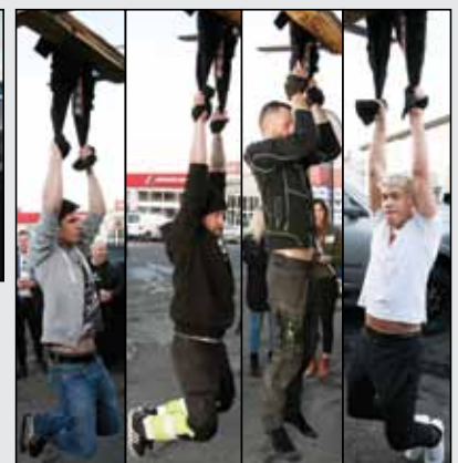
Keppt í buxnahangsi – Dómarinn og eftirlitsdómarinn færa allt til bókar og sjá um að keppnin fari fram samkvæmt reglum.