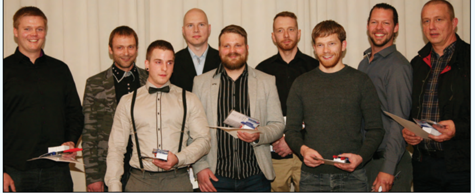
Fríður bópur sveina í þípulögnum, sem fengu Sveinsbréfin sín afbent 26. september s.l.