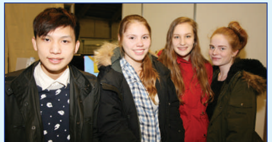
Unga fólk var ábugasamt og mætti vel í Kórinn 2014.

iðn- og verknámi og þeim fjölmörgu tækifærum sem nám í greinunum hefur upp á að bjóða. Gestir fá að snerta á og prófa hluti undir handleiðslu fagfólks í ýmsum greinum.