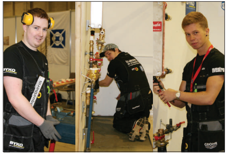
Myndirnar að ofan eru frá keppni pípulagninganema á Íslandsmótinu sem haldið var í Kórnum 2014.

Ísland mun senda sjö fulltrúa í keppnina í ár úr sjö iðngreinum og búast má við mikilli vinnu framundan. Það er gaman að segja frá því að fulltrúi okkar í pípulögnum er ekki að fara í „skemmtiferð“ heldur er hann að fara að keppa og er óhætt að segja að hann búi yfir miklu keppnisskapi