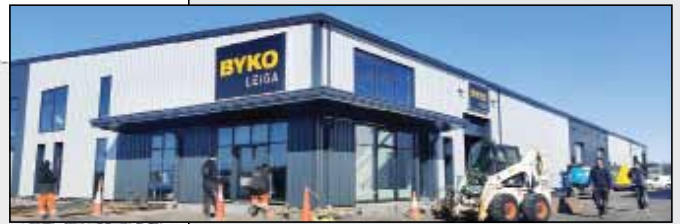
Teiknaða myndin til vinstri sýnir vinnutillögu að framhlið nýrrar verslunar BYKO Leigu. Að ofan: BYKO Leiga – bakhlið hússins á Selhelli.