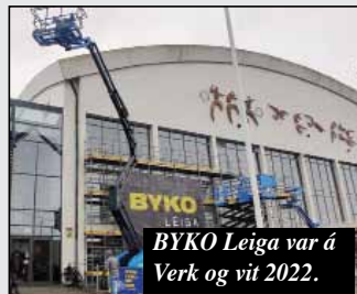
BYKO Leiga var á Verk og vit 2022.