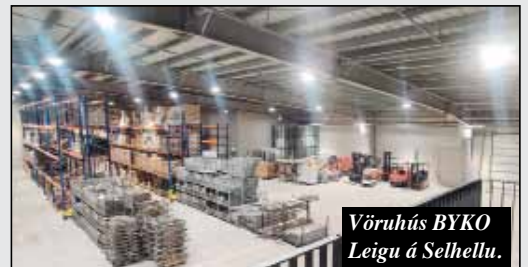
Vöruhús BYKO Leigu á Selhelli.