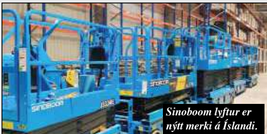
Sinoboom lyftur er nýtt merki á Íslandi.