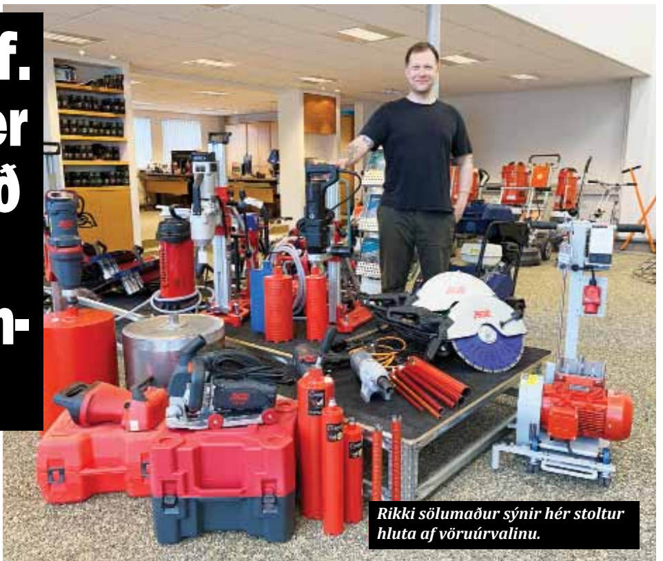
Rikki sölumaður sýnir hér stoltur hluta af vöruúrvalinu.

Gólfhitafræsariinn frá Adamas er í miklu upphaldi en hann er fyrirferðarlítil en mjög öflugur með breiðu demantssagarblaði.